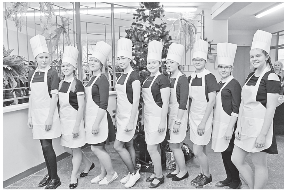
Поварихи-восьмиклассницы готовят вкусно!